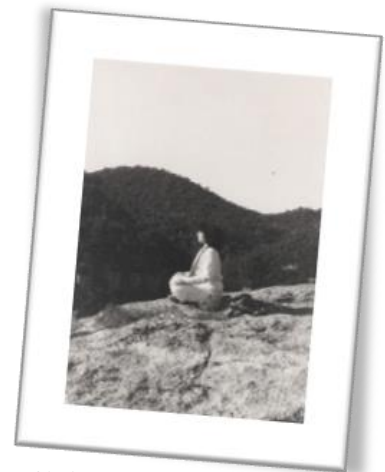
-1978- i el camí continua, no s'atura

La nostra escola es projecta desde el Yoga International Institute inspirat per Gandhi i fundat per Swami Gushananda (Jaume Guasch) en el 1974, fundador també de la Universitat Catalana de Yoga. Els nostres formadors provenen d'aquest llinatge.