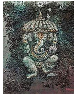
Ganesha, saviesa i prosperitat

La nostra formació es vivencial, l'aprenentatge es a través de l'experiència i la investigació individualitzada per Viure el Yoga, la unió, harmonia del cos-ment-emocions, de créixer en saviesa.